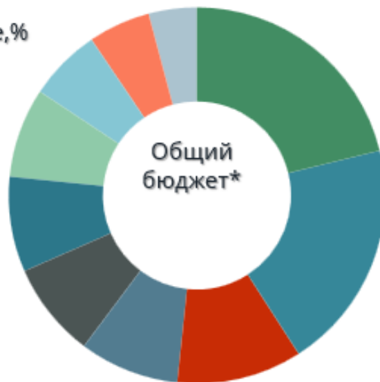
ТОП-10 радио по рекламными бюджетами, млн. грн. 2020 г.