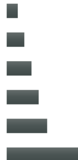
Время радиослушания в течение дня, TSL в минутах*

Крупнейший рекламодатель на радио - «...» сохранила свои бюджеты, а сектора «...», «...» и «...» показали рост (xx%, xx% и xx% соответственно).