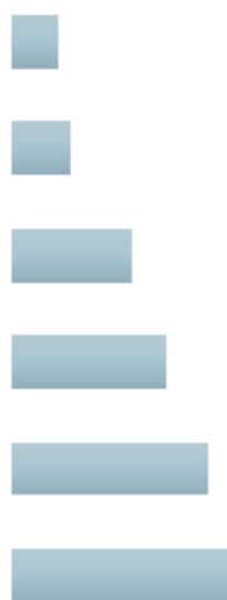
ТОП-10 рекламодателей на радио, млн. грн. 2020 г.

Средне­не­дель­ным охват по местам слушания радио, Reach%*