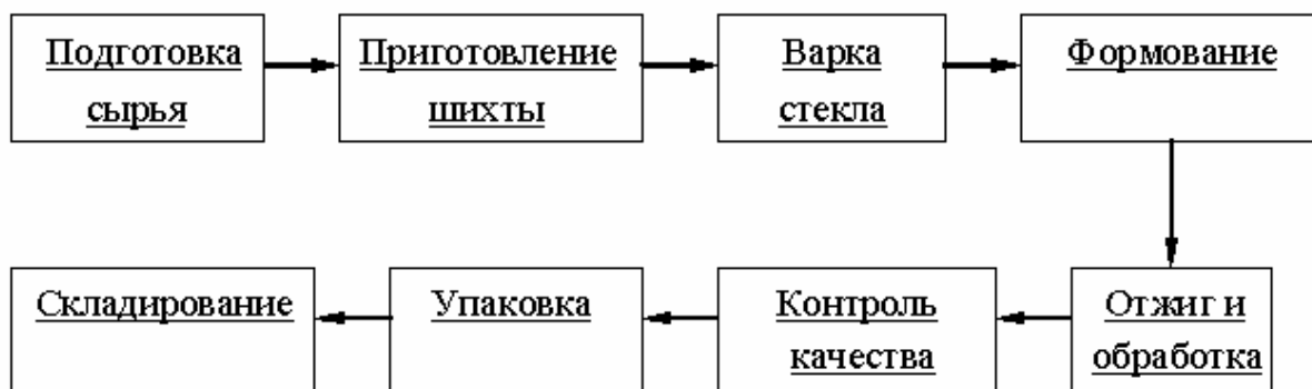
Рисунок 1. Типовая технологическая схема промышленного способа получения стекла

Традиционная технология промышленного способа получения стекла состоит из подготовки сырьевых материалов; приготовления шихты; варки стекла; охлаждения стекломассы; формования изделий; их отжига и обработки (термической, химической или механической). Затем стекло подвергается контролю качества, упаковывается и складировается (рис. 1).