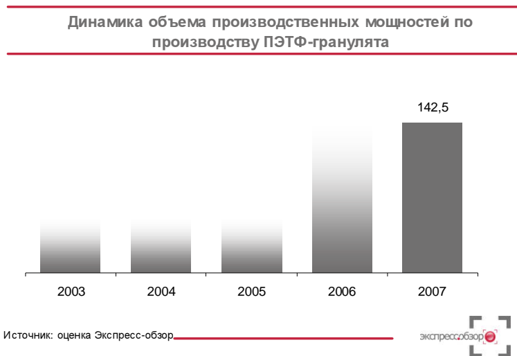
Рисунок 1. Динамика объема производственных мощностей по производству ПЭТФ-гранулята, тыс. тонн, 2003-2007 гг.

На данный момент времени в России действуют два завода, производящих ПЭТФ-гранулят. Это ОАО «Сибур-ПЭТ», работающий с конца 2003 года, и ООО «Завод новых полимеров «Сенеж», начавший производство в 2006 году. Суммарная мощность российских производителей ПЭТФ-гранулята составляет 142,5 тыс. тонн.