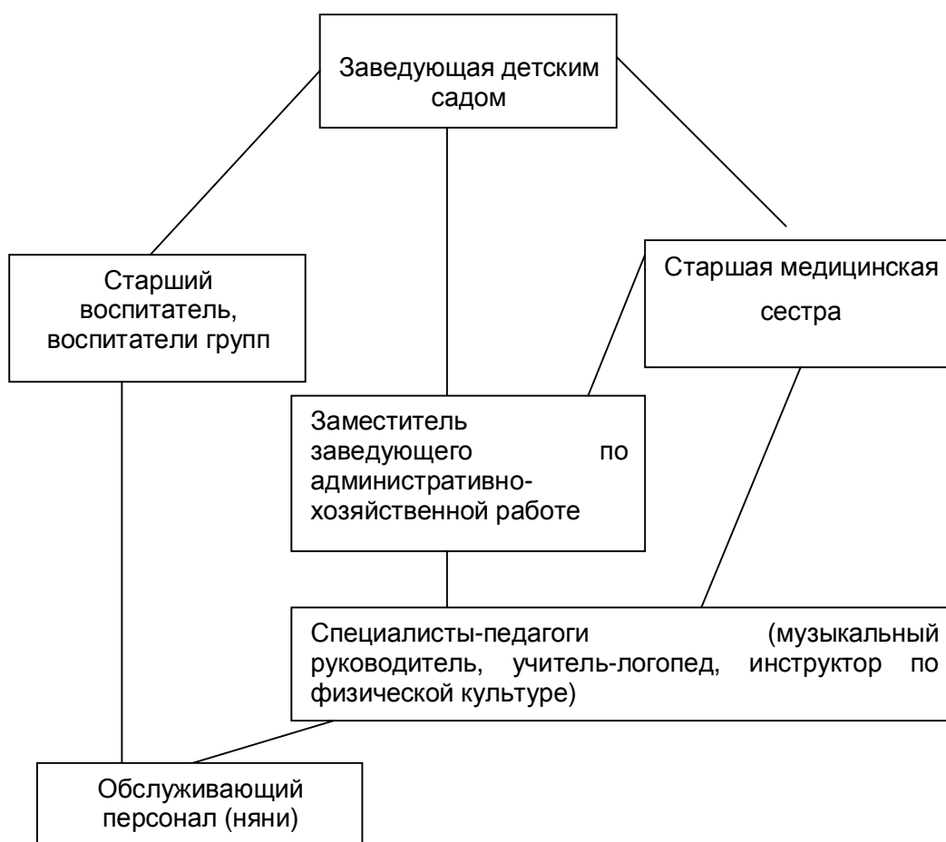
Схема 1. Структура управления детским садом

Детский сад имеет разветвленную структуру, которая выглядит следующим образом: