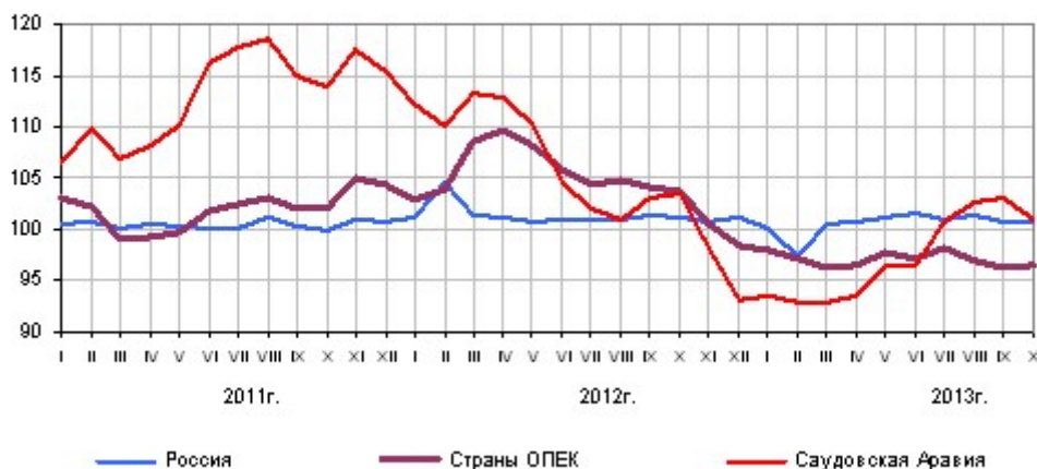
Динамика средней суточной добычи нефти в % к соответствующему месяцу предыдущего года

В октябре 2013г. средняя фактическая экспортная цена на нефть составила 750,3 доллара США за 1 тонну (98,9% к сентябрю 2013г.). Цена мирового рынка на нефть "Юралс" составляла 787,7 доллара США за 1 тонну (97,3% к сентябрю 2013г.).